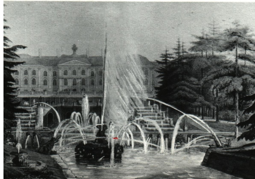
Residenset Petershov i Sankt Petersburg

Peter och Katarina gifte sig officiellt 1712 och de fick tolv barn tillsammans. Ingen av sönerna nådde dock vuxen ålder. Peter hade också tre söner med sin första hustru, endast en av dessa, Aleksej blev vuxen. Tsar Peter grundlade staden Sankt Petersburg. I Sankt Petersburg hade de också ett sommarpalats med 14 rum och de bodde i varsin våning. Katarina hade praktfulla salar med venetianska speglar och magnifika gobelänger.