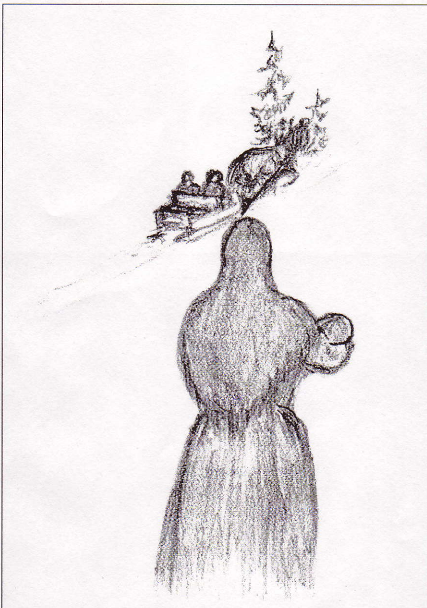
Teckning: Siv Holmqvist

Många gånger fick Brita Isacsdotter se personer i sin närhet försvinna med lagens långa arm som enda sällskap.