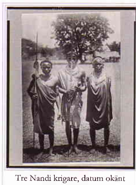
Tre Nandi krigare, datum okänt

Den Nandi är en kenyansk etnisk grupp eller stam som bor i fjällområdet av Nandi Hills i Rift Valley-provinsen . De utgör den näst folkrikaste undergrupp av Kalenjin . Den Nandi bor i Nandi län Uasin-Gishu län, Trans-Nzoia län, Nakuru län och delar av Narok län. Innan brittiska koloniseringen var de stillasittande boskap-herdar, ibland också öva jordbruket. Deras bosättningar var mer eller mindre jämnt fördelade i stället för att grupperas i byarna. Liksom andra nilotiska folk, de var noterades krigare. Dom tränar traditionellt omskärelse av båda könen, även om kvinnlig omskärelse är snabb bleknar som en ritual för invigning i vuxenlivet. Pojkars omskärelse festivaler ägde rum ungefär var sju och ett halvt år, och pojkar omskärs samtidigt anses tillhöra samma ålder som (kallas ibinda , PL ibinweek ). som nilotiska grupper, dessa andra ålder uppsättningar namngavs från ett begränsat fast cykel. Varje ålder som är vidare indelade i en delmängd ( siritieet , pl. Siritioik ). Ungefär fyra år efter den här festivalen, den tidigare generationen lämnade officiellt över försvaret av landet till de nyligen omskurna ungdomar. Flickors omskärelse, excising den klitoris , ägde rum i förberedelse för äktenskap.